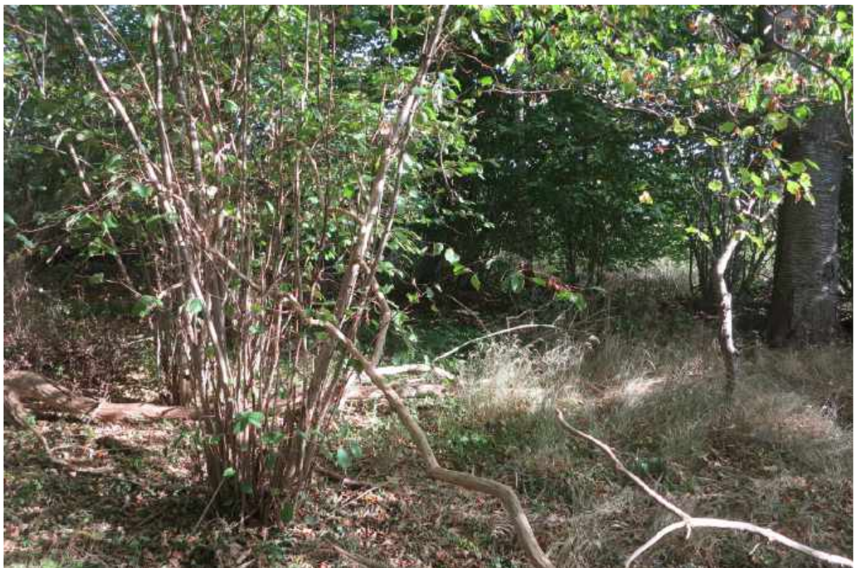
Der findes også gamle stævnede Hasler i skov nummer 4.