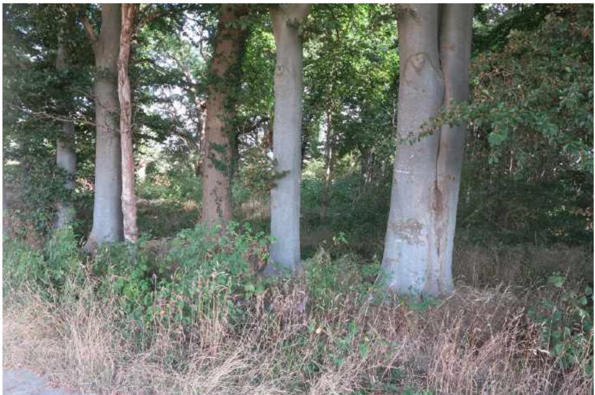
Skov nummer 3.