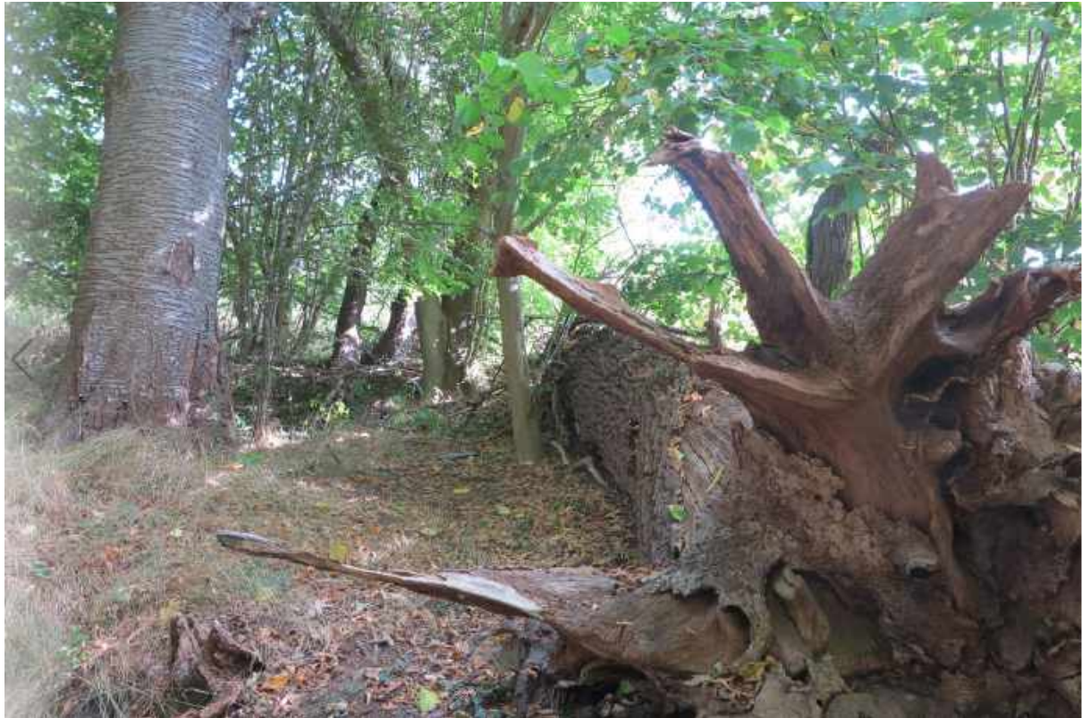
De biologiske værdier i skov nummer 4 er store – her faldet Eg samt stor gammel Fugle-Kirsebær