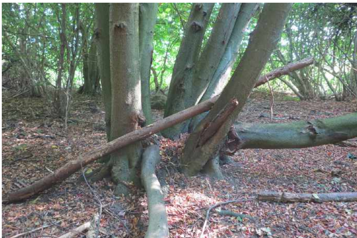
Stævnet "andet løv" i skov nummer 5.