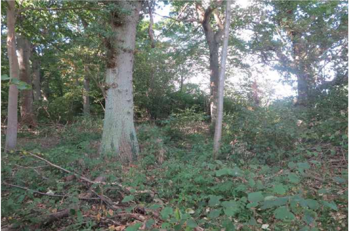
Skov nummer 1 er udelukkende bevokset med ældre ege.