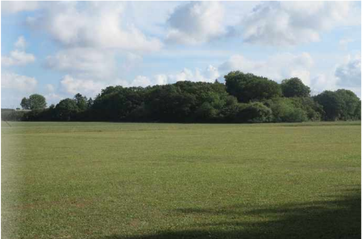
Skov nummer 5 set fra afstand