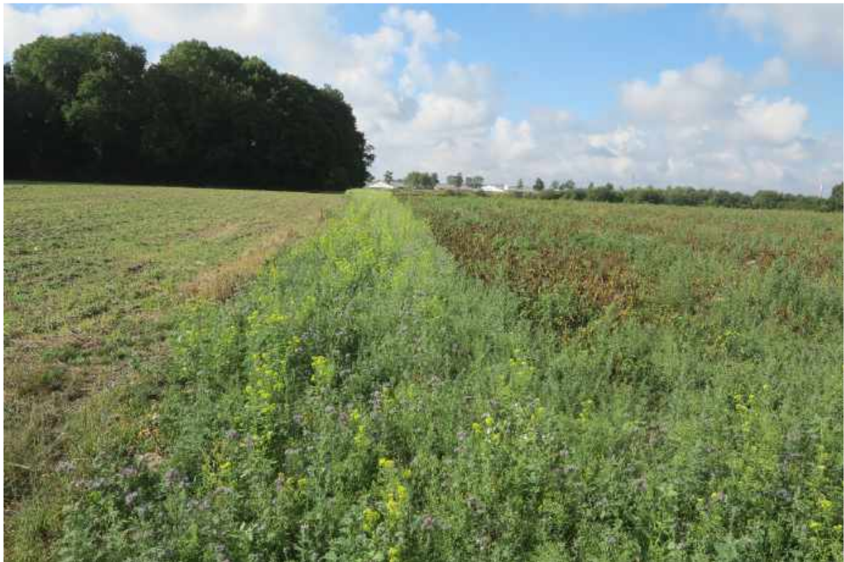
Skov nummer 2 set med udsået insektstribe