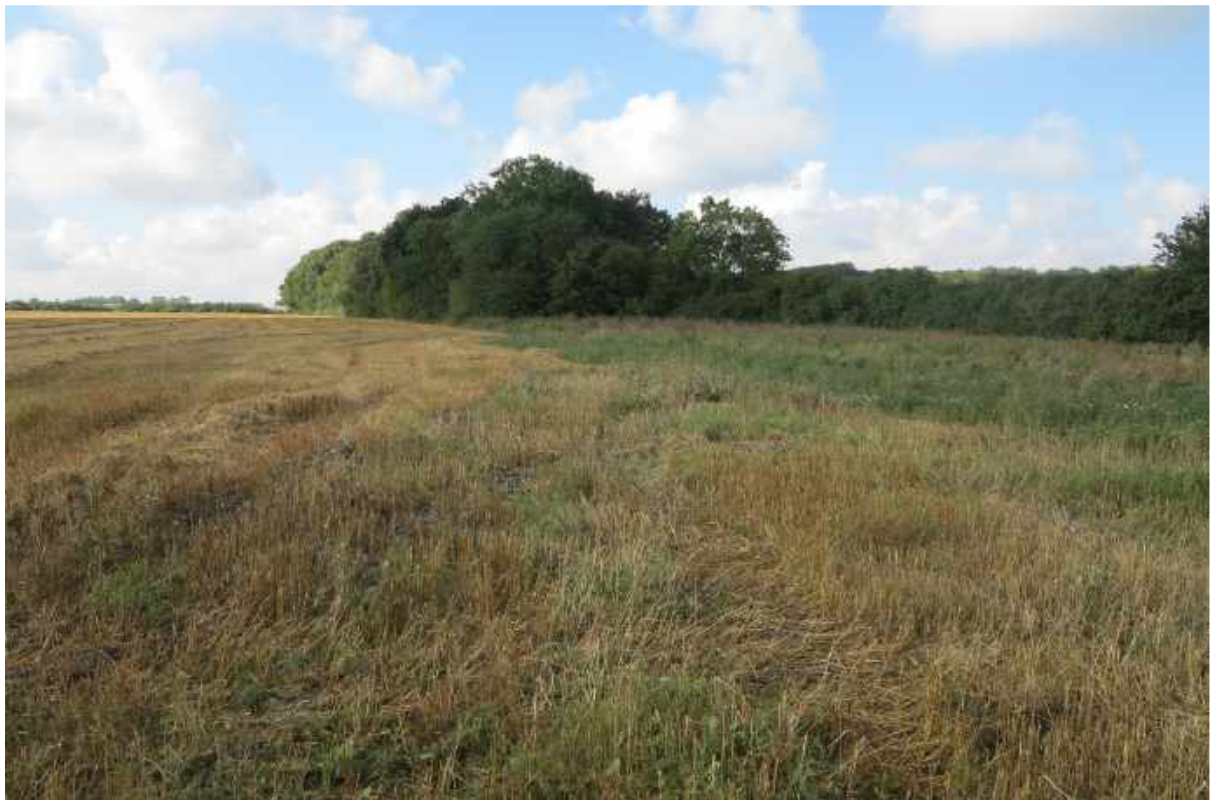
Skov nummer 4 set fra afstand med mindre braklagt areal.