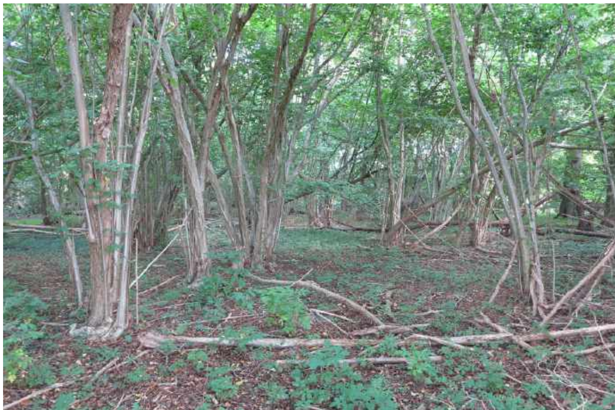
Et sådant syn set man ingen andre steder i Odenses skove – et virkelig natur hotspot