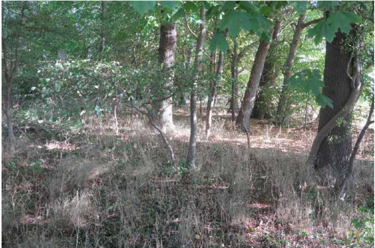
Skov nummer 4 er en af de mest værdifulde skove i området – lysåben og gamle træer