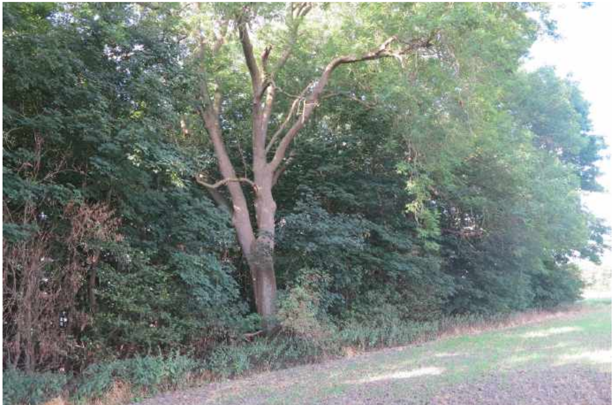
Ældre ask i skovbrynet i skov nummer 2.