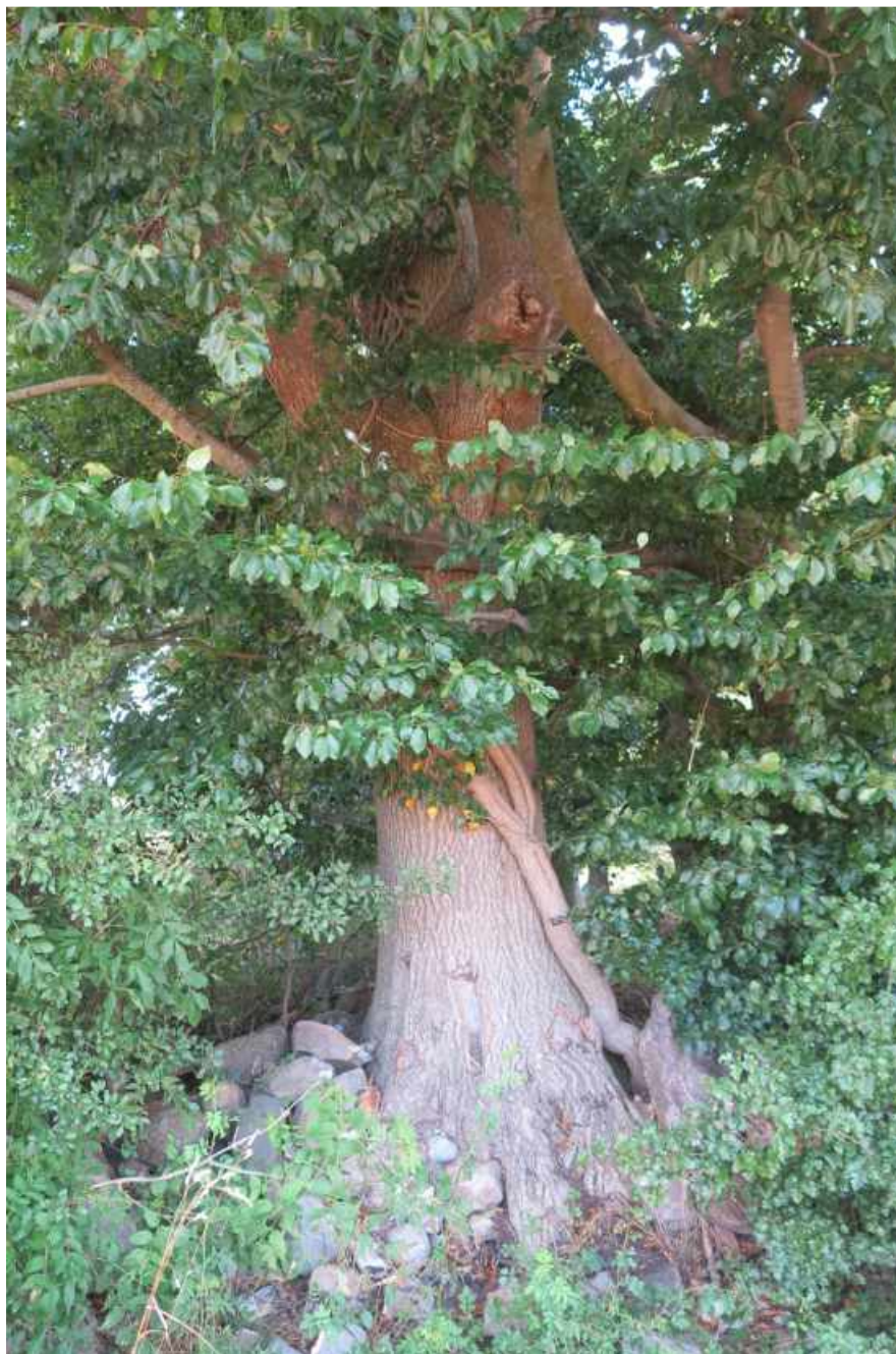
Skov nummer 3 med gammel eg med vedbend.