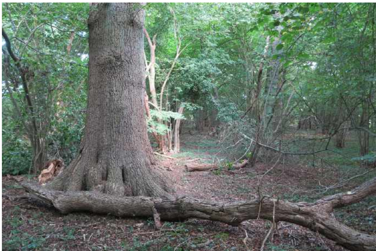
Dette er også et natur hotspot. Gammel eg med falden gren.