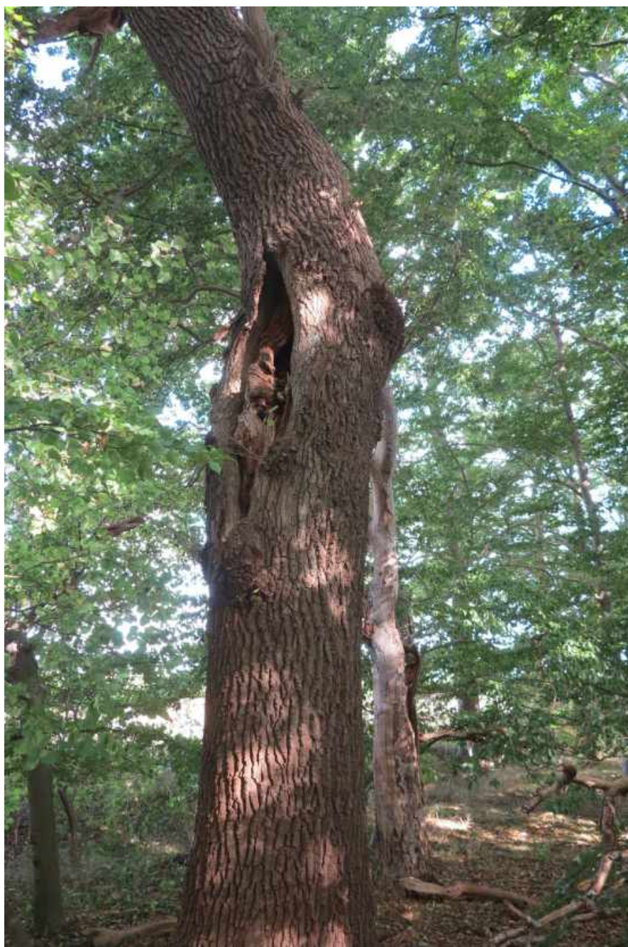
Gammel eg med huller.