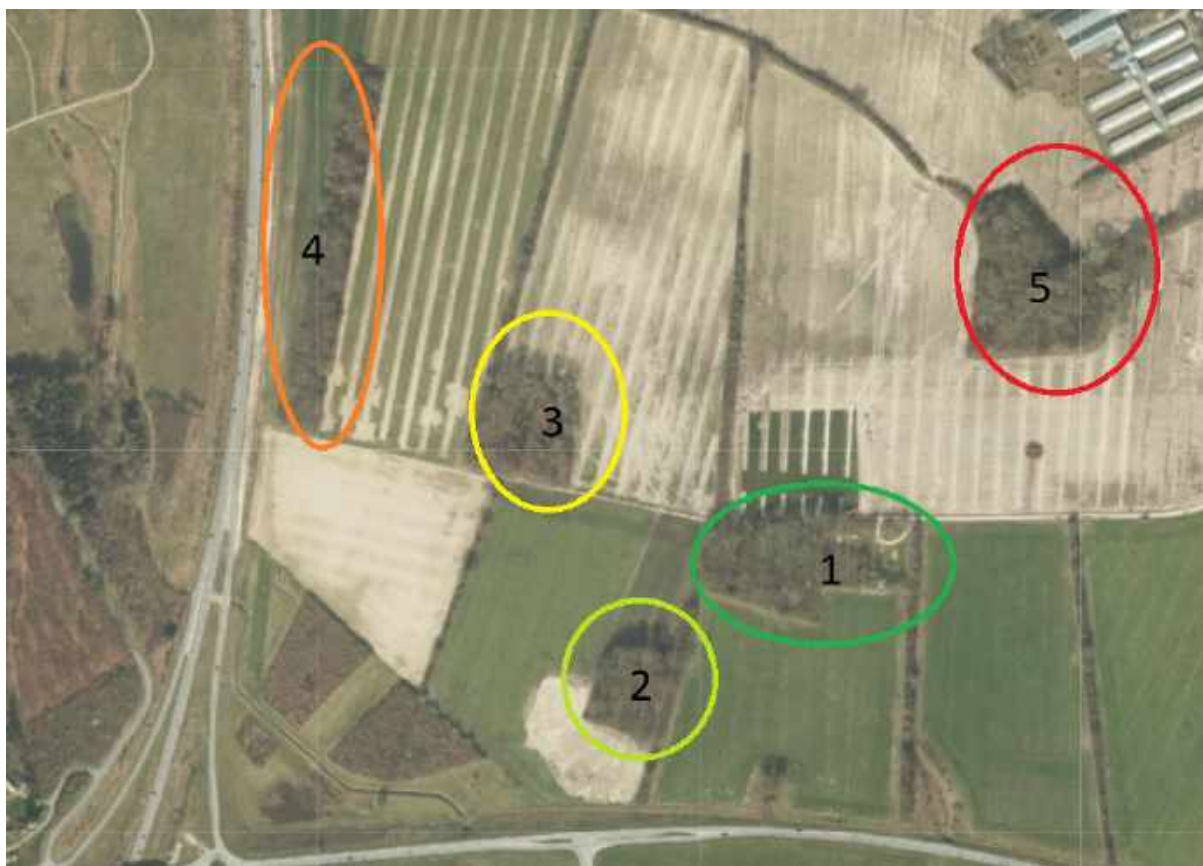
De 5 vigtige skove øst for Ring Øst.