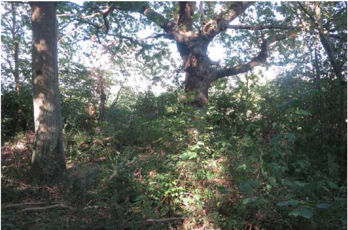
Ældre ege i skov nummer 1.