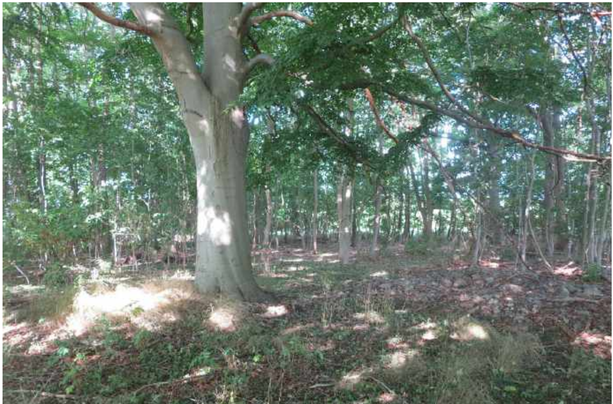
Gammel bøg i skov nummer 2.