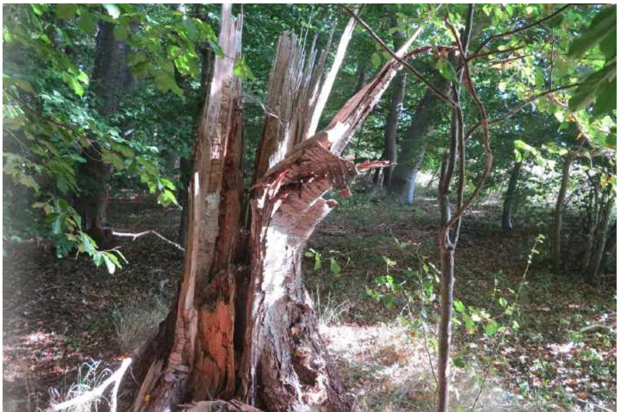
Skov nummer 4 med højstub.