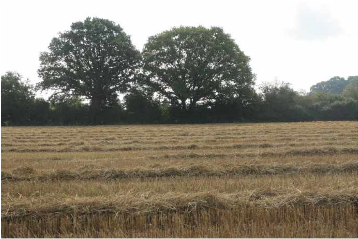
Skønt hegn med gamle ege.