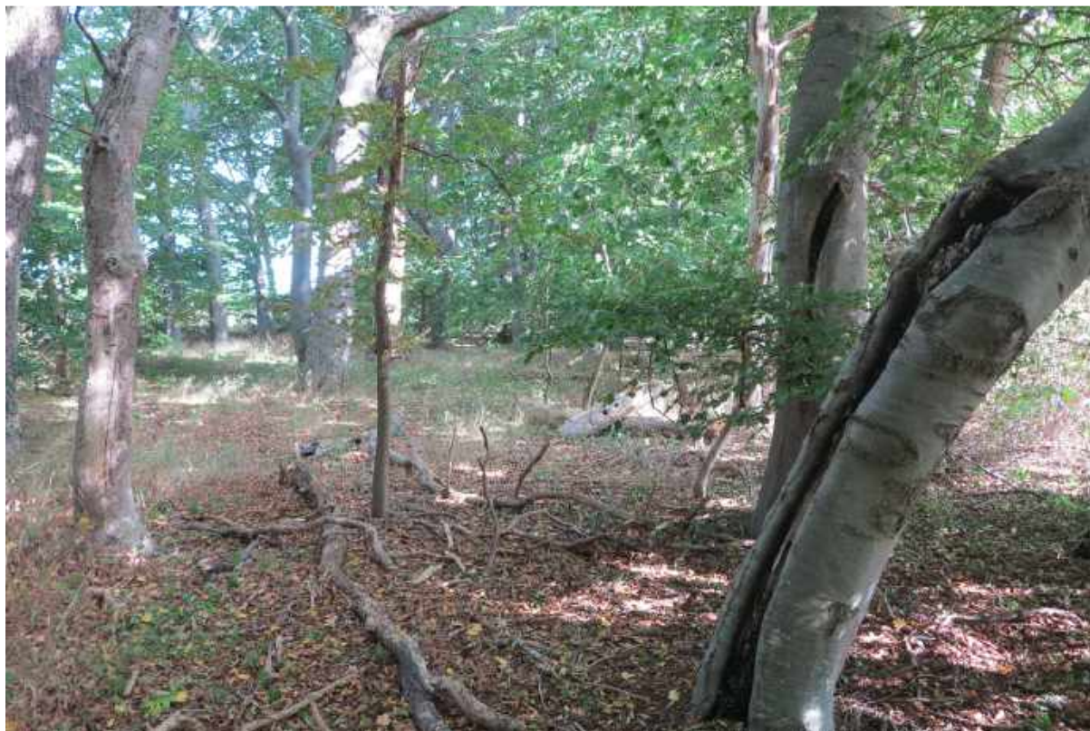
Skov nummer 4 er lysåben og med gamle bøg med huller.