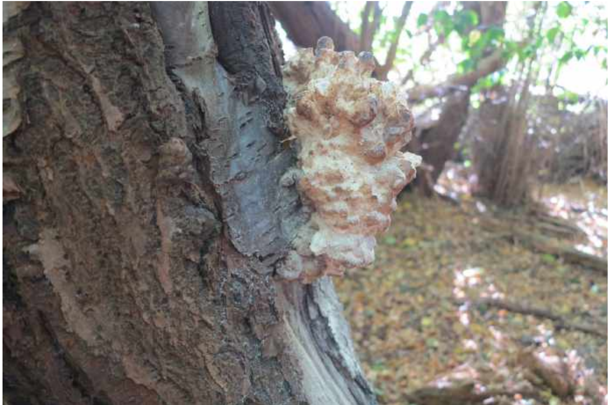
Svamp på gammel Fugle-Kirsebær.