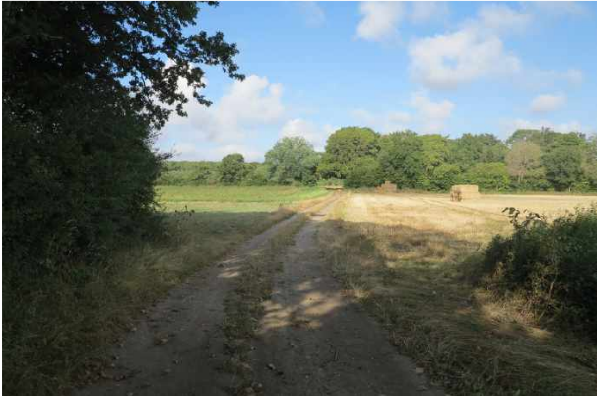
Skov nummer 3 set på afstand.